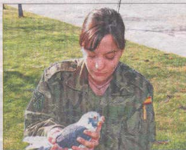
Una paloma mensajera, con su adiestradora militar.

Bautizadas con nombres medievales: Berenguela, Jimena, Ginebra, Rodrigo, Sancho, estas aves de caza, que suelen vivir más de 20 años, están listas y adiestradas a los pocos meses de nacer.